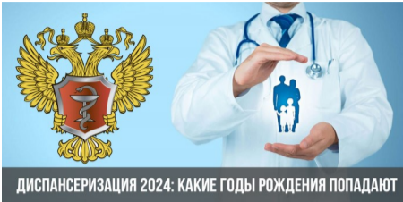
ДИСПАНСЕРИЗАЦИЯ 2024: КАКИЕ ГОДЫ РОЖДЕНИЯ ПОПАДАЮТ

Диспансеризация представляет собой комплекс мероприятий,