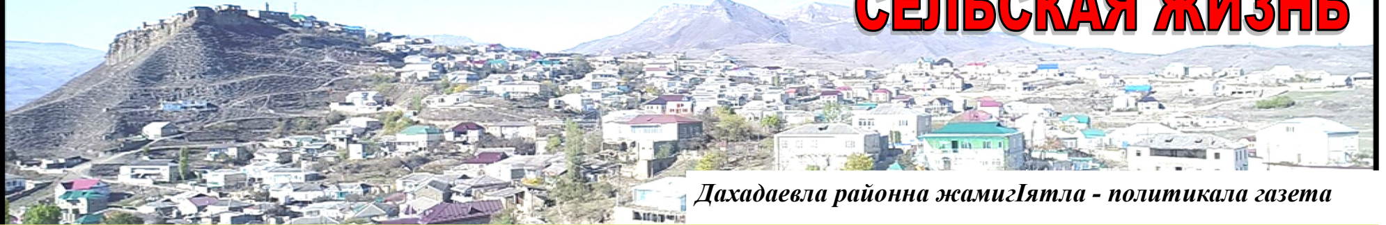
Дахадаевла районна жамиг'ятла - политикала газета