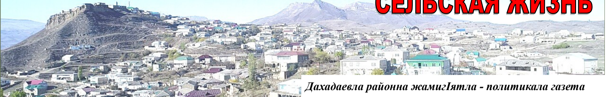
Дахадаевла районна жамиг'ятла - политика газета