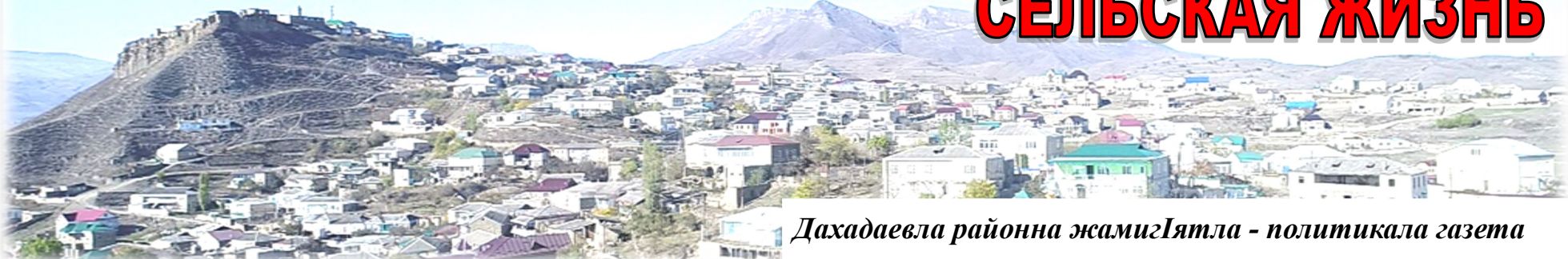
Дахадаевла районна жамигЯтла - политикала газета